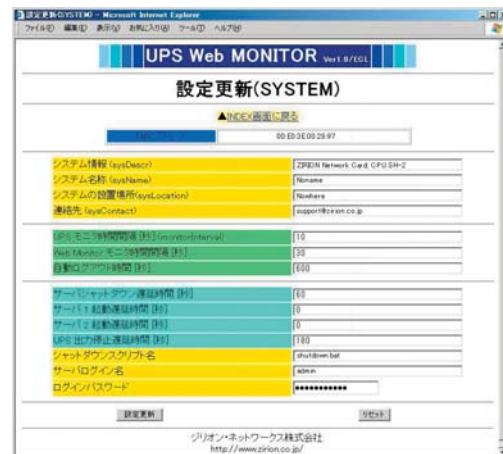
動作条件の設定画面

これらの項目の値を設定して、停電および復電時のInfobloxのシャットダウンと再起動のタイミングを調整することができます（下図）。